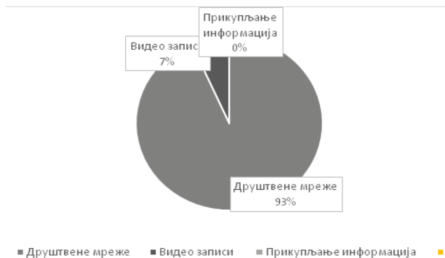
Графикон 3 Употреба интернета

На основу резултата може се закључити да испитаници у високом проценту одлазе у биоскоп, али ипак ретко. Често посећују ресторане, кафане и кафиће и присуствују спортским дешавањима. Знатно мањи број њих одлази у цркву, односно само 3 испитаника често одлазе у цркву, њих 20 ретко одлази, а само седморо никада.