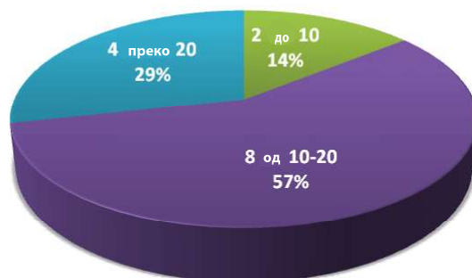
График 1 – Број испитаника по годинама радног стажа

На питање: Сматрате ли да је у раду са ментално ометеном дјецом наставни предмет Музичка култура једнако важан као и било који други наставни предмет? , сви испитаници (14) су дали позитиван одговор (График 2).