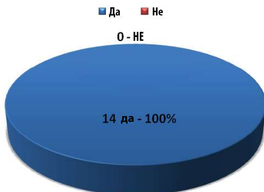
График 2 – Да ли је наставни предмет Музичка култура једнако важан као и било који други?

На питање: Сматрате ли да је у раду са ментално ометеном дјецом наставни предмет Музичка култура једнако важан као и било који други наставни предмет? , сви испитаници (14) су дали позитиван одговор (График 2).