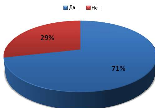
График 3 – Да ли редовно држите час Музичке културе?

На питање: Да ли редовно држите час Музичке културе? , 10 наставника је одговорило позитивно, док 4 наставника искрено признаје да се понекад догоди да због обимног садржаја осталих наставних предмета не стигну да одрже час Музичке културе (График 3).