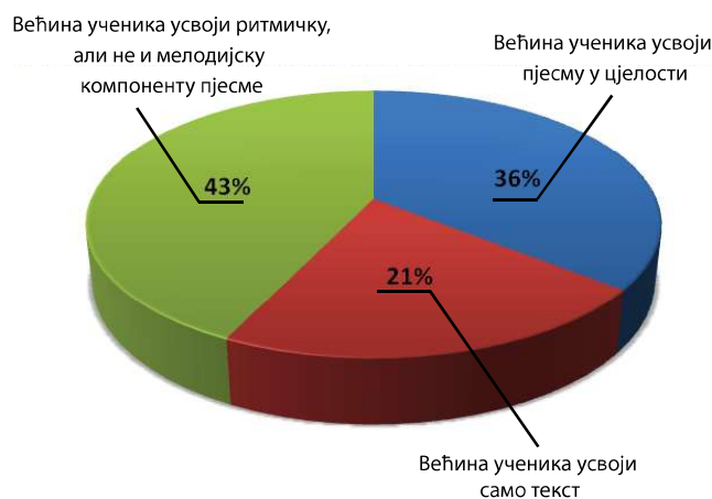
График 4 – Савладавање нове пјесме по слуху.

Када је у питању похваљивање и награђивање као мотивација, свих 14 анкетираних наставника изјављује да обавезно похвали своје ученике након успјешно изведене пјесме (Табела 2).