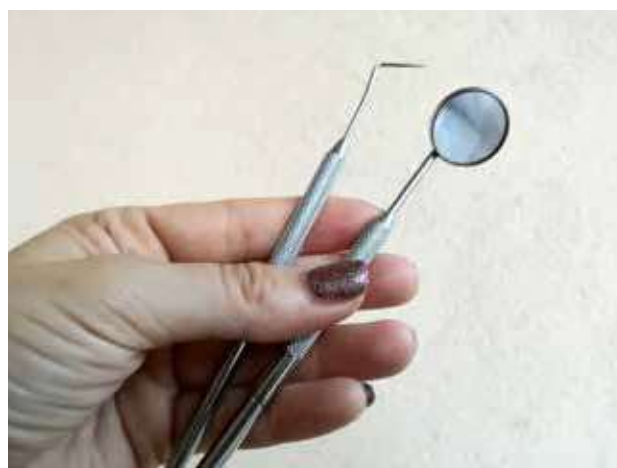
Slika 3.1. Realna fotografija stomatoloških instrumenata koji će biti korišćeni za pregled u rukama stomatologa

jenta kod kuće ili u ordinaciji korišćenjem aplikacije za posmatranje fotografija na mobilnom telefonu ( Slike 2.1-2.6 ). Posmatranje fotografija kroz aplikacije na mobilnim telefonima je imalo posebnu važnost u vidu pripremnih informacija za narednu seansu koja se obavljala uvek na prethodnoj seansi u stomatološkoj ordinaciji i u kućnim uslovima u vidu domaćeg zadatka. Na ovaj način, pacijenti i njihovi roditelji su se kroz posmatranje realnih slika stomatoloških instrumenata koji će biti korišćeni i vrste pregleda ili intervencije koja će biti obavljena, upoznavali sa budućim procedurama, čime je smanjena anksioznost i strah od nepoznatog a samim tim se postizala bolja saradnja ( Slike 3.1-3.2 ). Protektivna stabilizacija je podrazumevala topao zagrljaj roditelja, kako bi se pacijent osećao