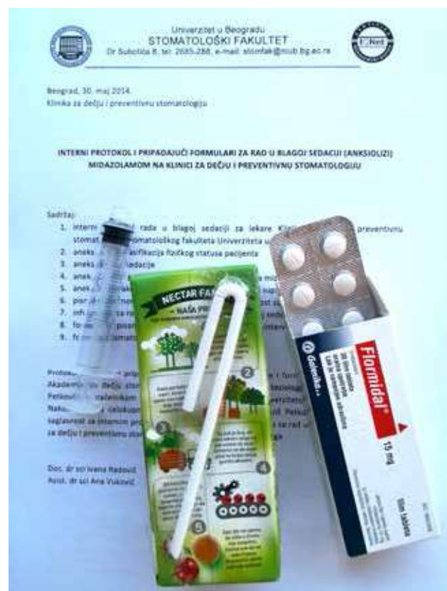
Slika 1. Interni protokol Klinike za dečju i preventivnu stomatologiju za rad u blagoj per os sedaciji pomoću midazolama.

tolog nisu osećali pritisak od neuspeha. Jednom pacijentu je prvo pružena kompletna sanacija usta i zuba u opštoj endotrahealnoj anesteziji zbog potrebe za urgentnim stomatološkim tretmanom, ali je pomoću TEACCH metode nastavljeno pružanje preventivnih i profilaktičkih stomatoloških mera. Kod dva pacijenta je prilikom primene TEACCH metode korišćena i blaga per os sedacija pomoću midazolama prema Internom protokolu Klinike za dečju i preventivnu stomatologiju u Beogradu (Slika 1).