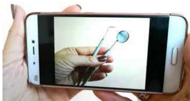
Slika 3.2. Posmatranje realne fotografije na mobilnom telefonu u rukama stomatologa.